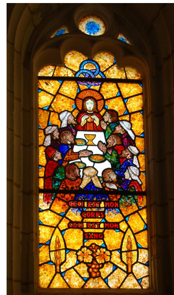
La Cène, 1956. Église Sainte-Marthe, Sainte-Marthe