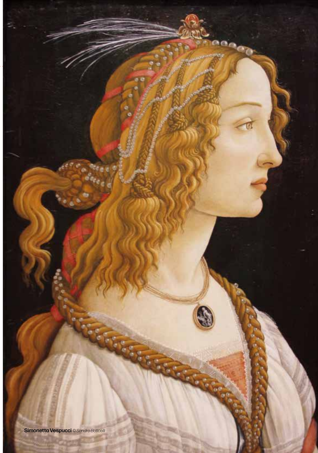
Simonetta Vespucci © Sandro Botticelli

Samedi 17 septembre de 14h à 18h (visite commentée sur demande) Musée du Verre - François Décorchemont Rue du docteur Paul Guilbaud 27190 Conches-sur-Ouche Entrée libre Animations sur réservation au 02 32 30 90 41 https://museeduverre.fr