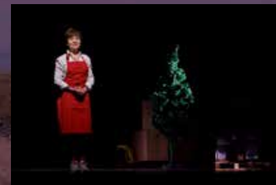
Longtemps je me suis levée tôt