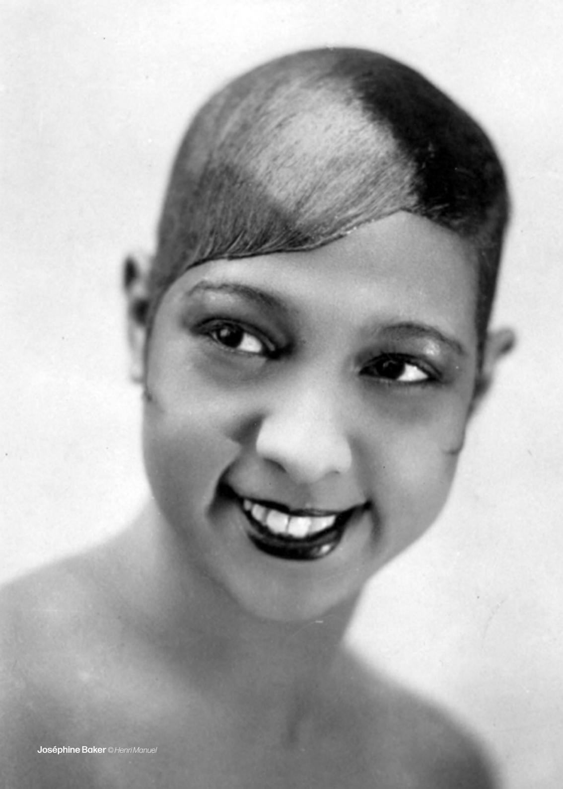
Joséphine Baker