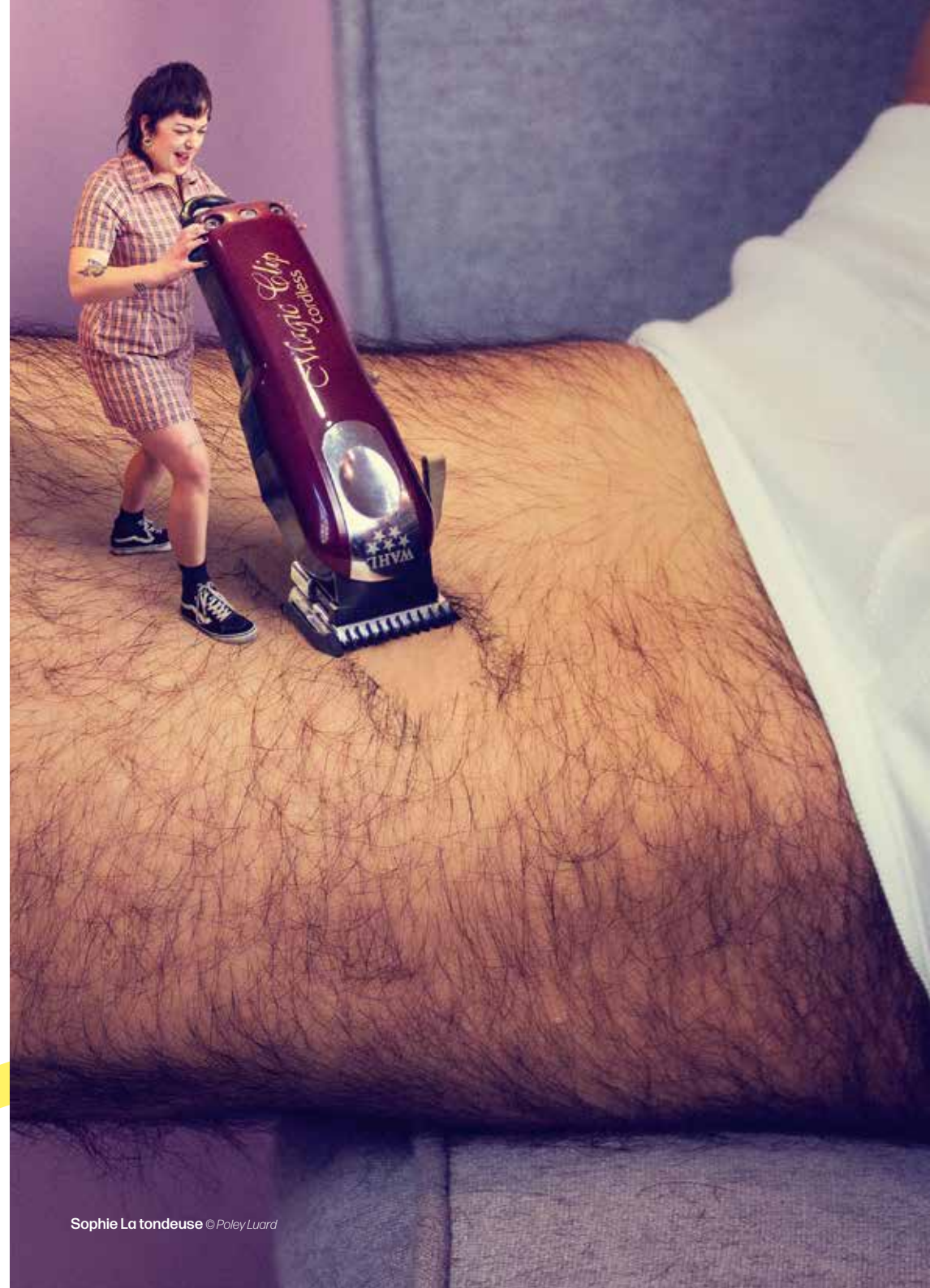
Sophie La tondeuse © Poley Luard

Vendredi 16 septembre à 12h30 (1h) Maison de l'Université 2 place Émile Blondel 76130 Mont-Saint-Aignan Gratuit - Réservations au 02 32 76 92 27 ou culture-scientifique@univ-rouen.fr www.mdu.univ-rouen.fr