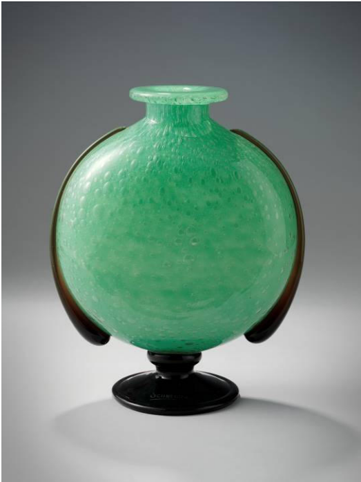
► Verrerie Schneider, Vase larmes, 1920-1925 (Achat Galerie Choses et Autres choses)