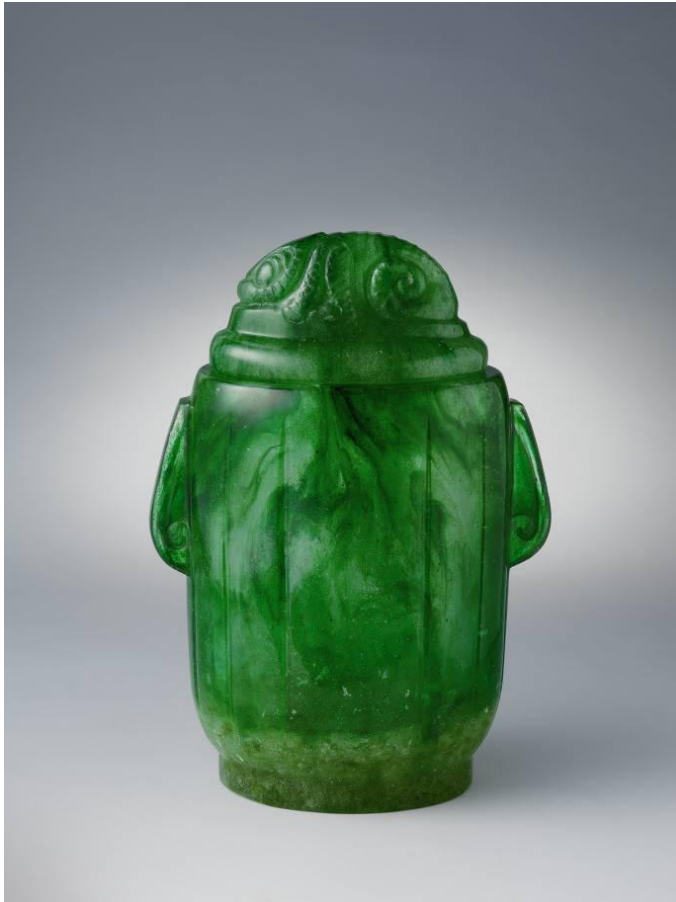
► François Décorchemont Pot ovale couvert Modèle crée en 1933 Exemplaire réalisé en 1965 (Don Barlach Heuer)