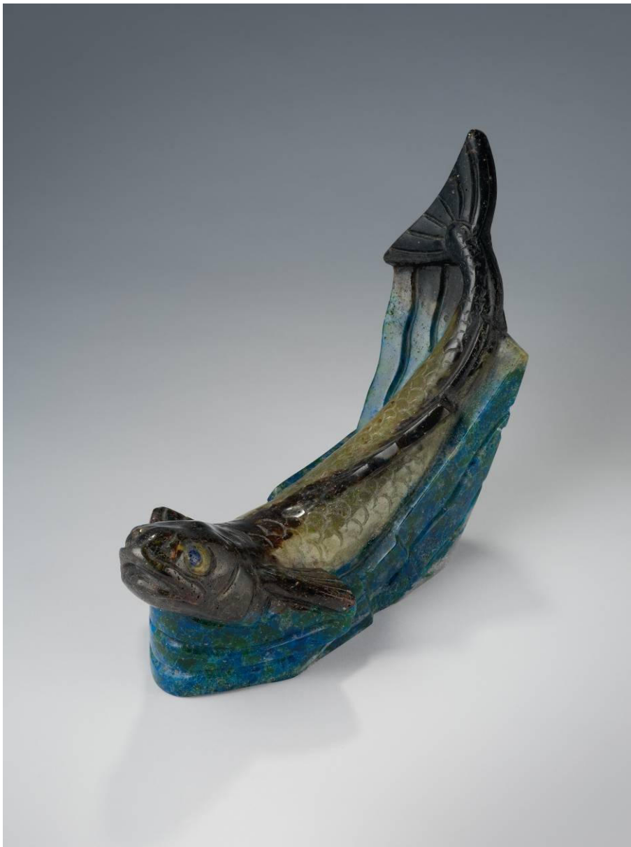
▼ François Décorchemont, Poisson, Modèle créé en 1949, exemplaire de 1958 (Don de Barlach Heuer)

A travers les récentes expositions temporaires consacrées aux verreries Schneider et Legras, le champ d'étude du musée du verre de Conches s'est élargi aux verreries de la première moitié du XXe siècle. Ces expositions ont favorisé de nombreux dons de collectionneurs et de galeristes dans les domaines de l'Art Nouveau (Legras, Loëtz,...), de l'Art Déco (Décorchemont, Schneider ...) et de l'esthétique verrière années 1950 (Thuret, Maté Lapierre ...). En inaugurant de nouvelles vitrines destinées à ces verreries, le musée souhaite exprimer ses remerciements aux nombreux donateurs, et tout particulièrement au grand amateur d'art verrier Barlach Heuer.