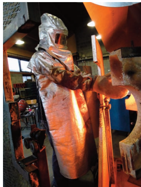
Verronaute, Sars-Poteries, 2013.

« Glass Faces » est un hommage ouvert. Cette exposition a l'honneur de se tenir dans un Musée du verre qui ne manque pas de projets et d'ambition, celui de Conches, qui participe pour la première fois à la Biennale Photographique de Conches placée sur le thème particulièrement judicieux de Confrontation(s) .