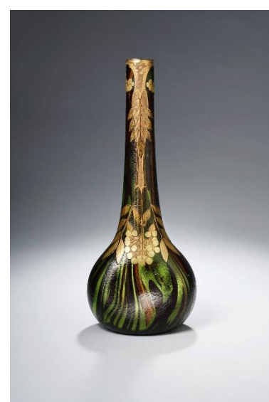
Vase berluze, décor gravé à l'acide de feuilles et cerises de laurier rehaussées d'or, fin XIXe siècle. H. 43,2 cm