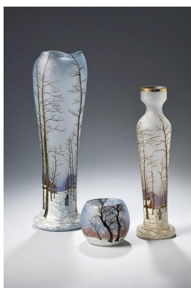
Vases à décor émaillé de paysanne cheminant à l'orée d'un bois enneigé, début XXe siècle. H. 8 à 41 cm