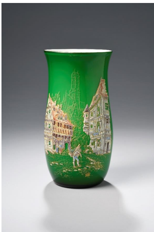
Vase bulbeux à fond opalin blanc doublé vert émeraude, à décor émaillé d'une scène moyenâgeuse d'un colporteur de verre passant devant une échoppe Legras. Vers 1890. H. 25,3 cm

Inauguré le 25 juin 2022, le nouveau musée du verre François Décorchemont a, depuis, bénéficié de plusieurs donations importantes qui viennent enrichir ses collections. L'année 2023 est, entre-autre, consacrée à les présenter au public. Ainsi, du 13 mai au 26 novembre, le musée consacrera une exposition dédiée aux verreries Legras provenant de la donation Vitrat, un don de 150 pièces de François-Théodore Legras (1839-1916), célèbre verrier et l'un des acteurs de l'Art nouveau. Son œuvre, de renommée mondiale, s'est déployée à travers un nombre considérable de modèles, de formes et de décors. Dirigées par François-Théodore Legras, puis par ses neveux, les verreries réunies de Saint-Denis et de Pantin figurent parmi les plus importantes de la fin du XIXe et du début du XXe siècle. Parallèlement à la production de carafes à sujets et de services de table, les deux manufactures développèrent aussi leurs activités vers la création de verreries d'art, dont les décors émaillés et parfois gravés de fleurs, de feuilles et de paysages firent la réputation des établissements.