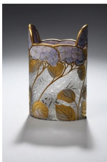
Vase droit à fond incolore de mimosa et à décor émaillé d'hortensia et de feuillages d'or, début XXe siècle. H. 12,5