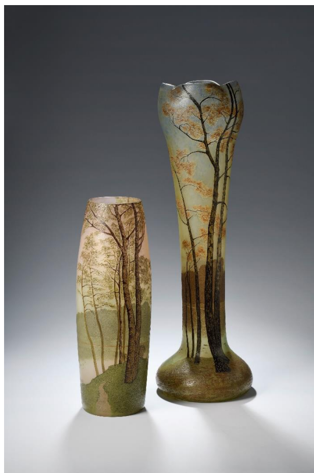
Vase, paysage d'automne

Il s'agit de la gravure à la roue. Auparavant, elle ne servait qu'à souligner un détail ou une courbe mais après la Première Guerre mondiale puis dans les années 1920, quand la verrerie de Saint-Denis est rachetée par Souchon-Neuvesel, l'usage de la gravure à la roue permet de réaliser des motifs stylisés au nouveau goût de l'époque pour l'Art Déco. Sans être repris à l'émail, ces décors semblent pourtant perdre ce qui avait fait la réputation des verreries Legras, à savoir la qualité des décors émaillés.