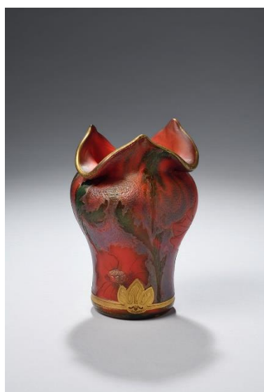
Vase balustre à décor gravé à l'acide de pavots et de motifs dorés à la base, début XXe siècle. H. 16 cm