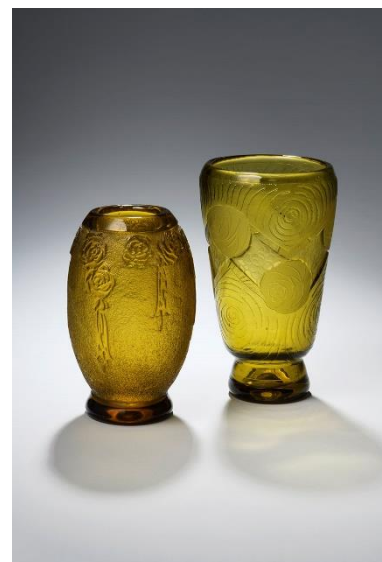
Vases à fond dépoli jaune et à décor florale gravé à la roue, vers 1920. H. 21,5 à 25 cm