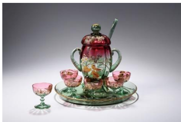
Service à fruits baril, service à fond verdoyant, à décor émaillé de fleurs, fruits et feuilles de ronces, vers 1890. H. 24 cm