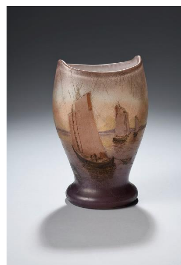
Bonbonnière Cancale, paysage gravé, début XXe siècle. H. 17 cm