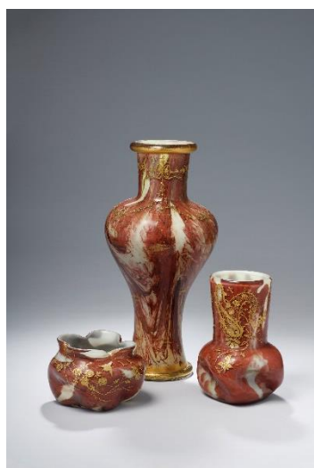
Coupe et vases à fond opalin, doublé rouge de chine, à décor florale d'or. Modèle de l'Exposition universelle de 1889. H. 10, 5 à 42, 5cm