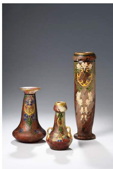
Vases arabisants, motifs émaillés, fin XIXe siècle. H. 17 à 35 cm