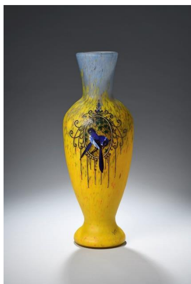
Vase Amboise, série Printania, décor émaillé d'un couple de pies dans un médaillon, début XXe siècle. H. 54 cm