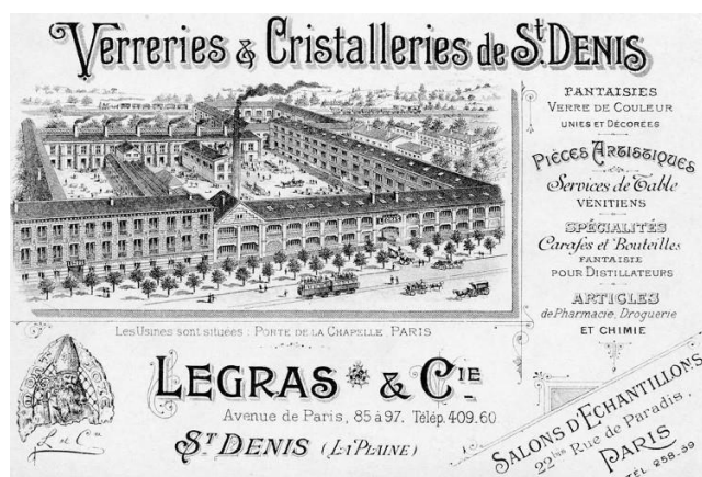
La verrerie de Saint-Denis à la fin du XIX e siècle