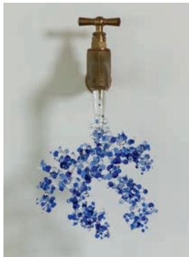
Goutte à goutte, 2022