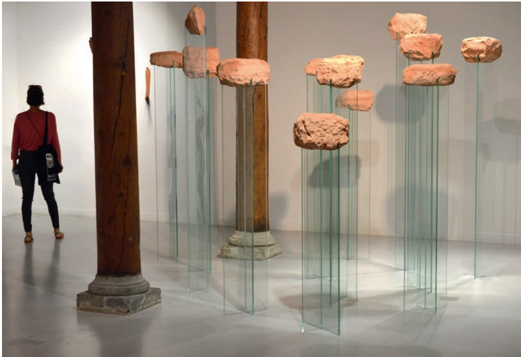
Soulever les montagnes, 2020